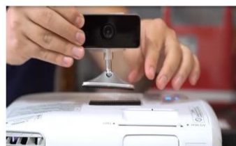
(3) Cole a outra dupla face no projetor e junte ao sensor O sensor deve estar virado para a mesma imagem da projeção