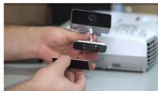
(2) Cole a fita dupla face embaixo do suporte