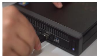
(5) e o USB ao computador