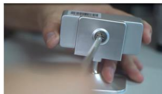
(1) Parafuse o sensor no suporte

Instale o dispositivo de calibração no projetor ou no teto a distância de aproximadamente 2,2 metros à 3,2 metros