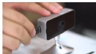
(4) Encaixe o conector do cabo ao sensor