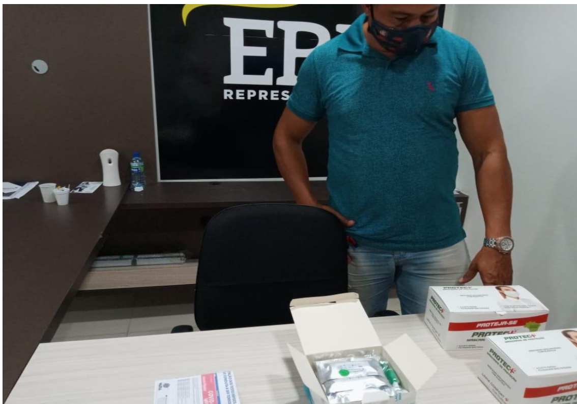
Foto: Escritório e produtos empresa Everton