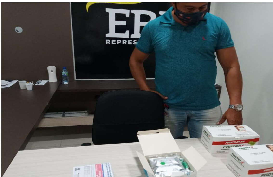
Foto: Escritório e produtos empresa Everton