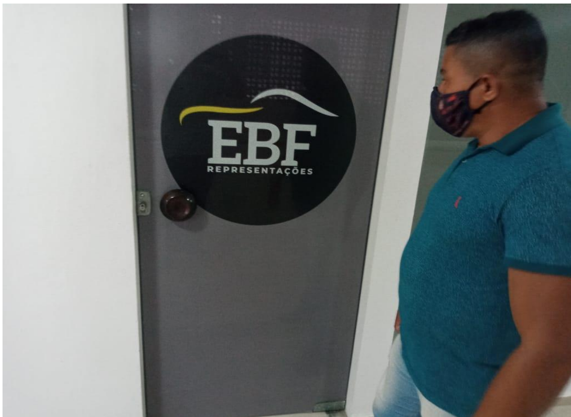
Foto: Entrada, novo endereço empresa Everton