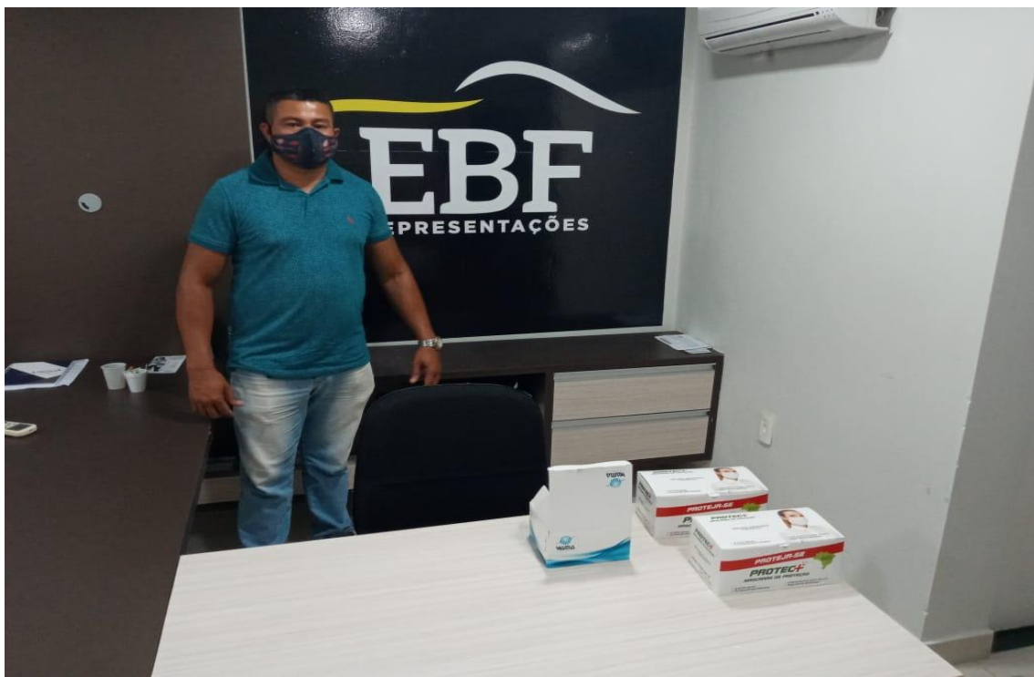
Foto: Escritório e produtos empresa Everton